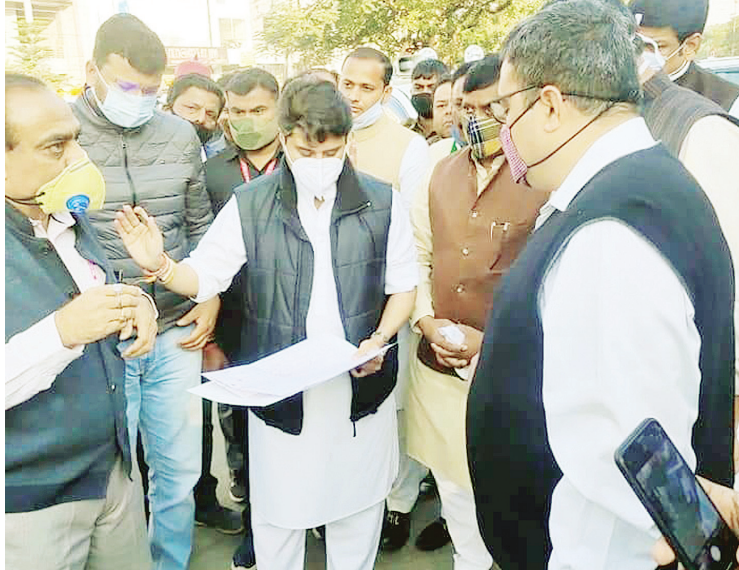
सामने ही प्रतिमा शिफ्ट करने का फैसला किया था। तभी से इस बारे में अंतिम फैसला होने का इंतजार हो रहा था, क्योंकि यह निर्णय ज्योतिरादित्य सिंधिया को करना था।

नगर प्रतिनिधि इंदौर। निर्माणधीन बंगाली पलायओवर के मध्य भाग निर्माण में बाधक बनी स्व. माधवराव सिंधिया की प्रतिमा ब्रिज के पास गोयल नगर जैन मंदिर के सामने ही स्थानांतरित की जाएगी। स्व. सिंधिया के पुत्र राज्यसभा सदस्य ज्योतिरादित्य सिंधिया ने शुक्रवार सुबह स्थानीय भाजपा नेताओं और अधिकारियों के साथ दौरा कर प्रस्तावित स्थल देखा और पहले से तय की गई जगह पर प्रतिमा शिफ्ट करने पर मुहर लगा दी।